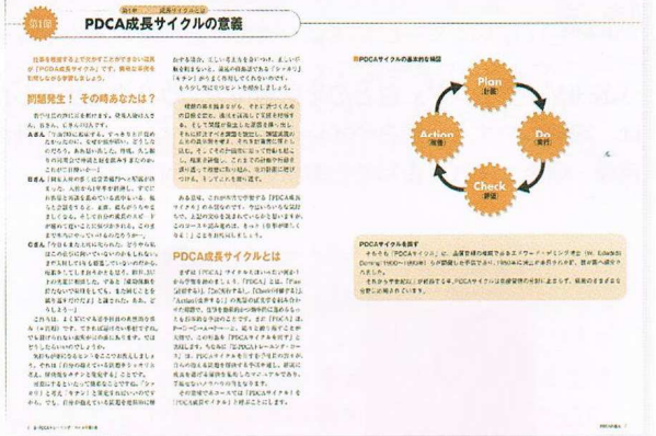
【第1巻】PDCA 成長サイクルの意義