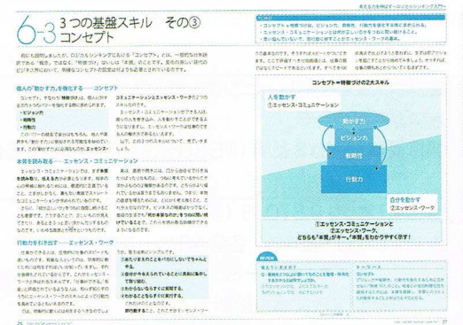
【VOL.1】3つの基礎スキル その③コンセプト