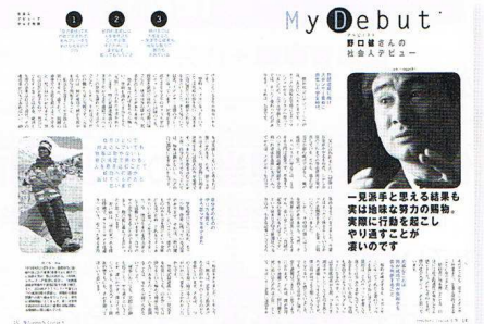
【第5巻】マイ・デビュー